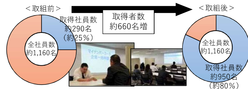
C社のマイナンバーカード取得状況