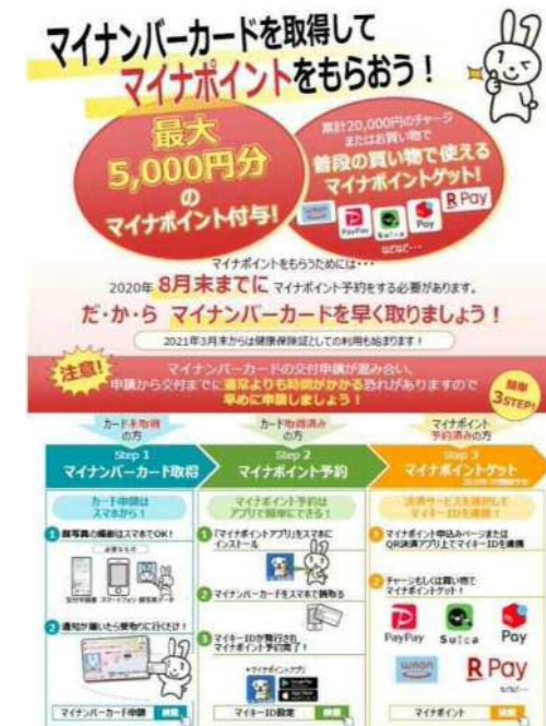
社員向マイナンバーカード 取得啓発用ポスター